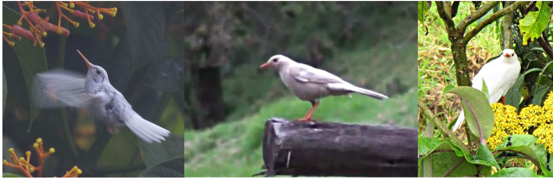
Figura 6: Individuos albinos de Colibrí Jaspeado Adelomyia melanogenys del Lodge Santa Lucia, prov. de Pichincha (izquierda); y de Mirlo Grande Turdus fuscater de la Reserva Mazán, prov. de Azuay (centro) y de la vía Carmelo - Julio Andrade, prov. de Carchi (derecha).

Gralaria Leonada, Grallaria quitensis . Un individuo adulto fue observado en Paluguillo, páramo de Guamaní-Papallacta, Pichincha, en noviembre de 2013. El ave mostró un probable caso de leucismo debido a que exhibió la garganta, parte del pecho, cuello y espalda de color blanquecino. El individuo fue observado durante varios minutos mientras saltaba entre árboles de Polylepis sp.