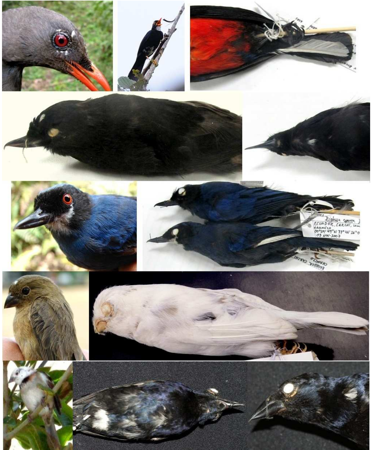
Figura 3: Casos de leucismo en Mirlo Grande Turdus fuscater de Cuyuja, prov. de Napo (1ª fila, izquierda); Mirlo Negribrillos Turdus serranus de Cosanga, prov. de Napo (1ª fila, centro); Tangara Montaña Ventriescarlata Anisognathus igniventris de la Cordillera Virgen Negra, prov. de Carchi (1ª fila derecha); Pinchaflores Negro Diglossa humeralis de Misha Guayco, prov. de Cotopaxi (2ª fila, izquierda); y de Páramo de Pichán, prov. de Pichincha (2ª fila, derecha); Pinchaflores Enmascarado Diglossa cyanea de El Chamizo, prov. de Carchi (3ª fila); Espiguero Ventricastaño Sporophila castaneiventris del Río Liquino, prov. de Pastaza (4ª fila, izquierda); Semillero Paramero Catamenia homochroa de San Tadeo, prov. de Pichincha (4ª fila, derecha); Gorrión Ruficollarejo Zonotrichia capensis de Quito, prov. de Pichincha (5ª fila, izquierda); y Vaquero Brillante Molothrus bonariensis de Yunguilla, prov. de Azuay (5ª fila, centro y derecha).