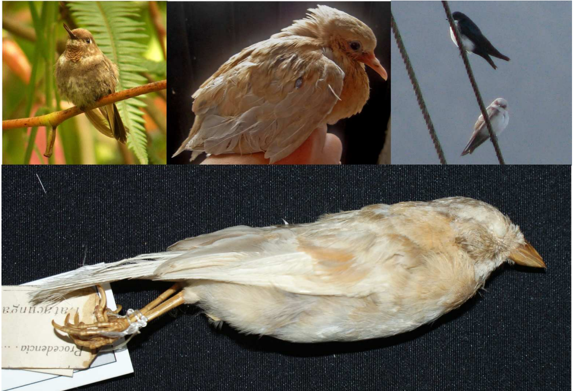
Figura 4: Individuos con esquizocroísmo feo de Soláugel Goliflama Heliangelus micraster de Tapichalaca, prov. de Zamora-Chinchi (arriba izquierda); de Tortola Orejuda Zenaida auriculata de Quito, prov. de Pichincha (arriba centro); de Golondrina Azuliblanca Pygochelidon cyanoleuca de Atahualpa, prov. de Pichincha (arriba derecha, junto a un individuo en plumaje normal); y de Gorrión Ruficollarejo Zonotrichia capensis de Poaló, prov. de Cotopaxi (abajo), Ecuador.