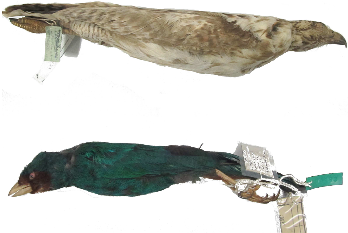
Figura 7: Dos especímenes con coloración atípica que no pudieron asignarse confiablemente como casos de aberración cromática debido a posibles efectos de la edad del espécimen ( Buteogallus anthracinus , EPN 095, arriba) o a posible alteración debida a sustancias químicas ( Chlorornis riefferii , QCAZ963, abajo).

El leucismo ha sido reportado más frecuentemente en especies observadas dentro de áreas urbanas [13]. Sin embargo, la recopilación de registros de alteraciones de plumaje encontrada en el Ecuador indicó una mayor frecuencia de leucismo en especies observadas en áreas rurales 70 % ( n = 43 ), lo que podría deberse a que estas áreas generalmente presentan mayor riqueza de especies comparado a las zonas urbanas y por ende hay mayor atención por parte observadores de aves; pero hay que destacar que la mayoría de registros ecuatorianos de alteraciones provienen de especies tolerantes a ambientes antropogénicos y con poblaciones abundantes como Zenaida auriculata , Colibri coruscans , Turdus fuscater , Molothrus bonariensis y Zonotrichia capensis , y cuya distribución es principalmente andina [16]. En consecuencia la región Altoandina tuvo un mayor porcentaje de registros mientras la región amazónica, que posee la mayor riqueza de especies del país, registró sólo dos casos.