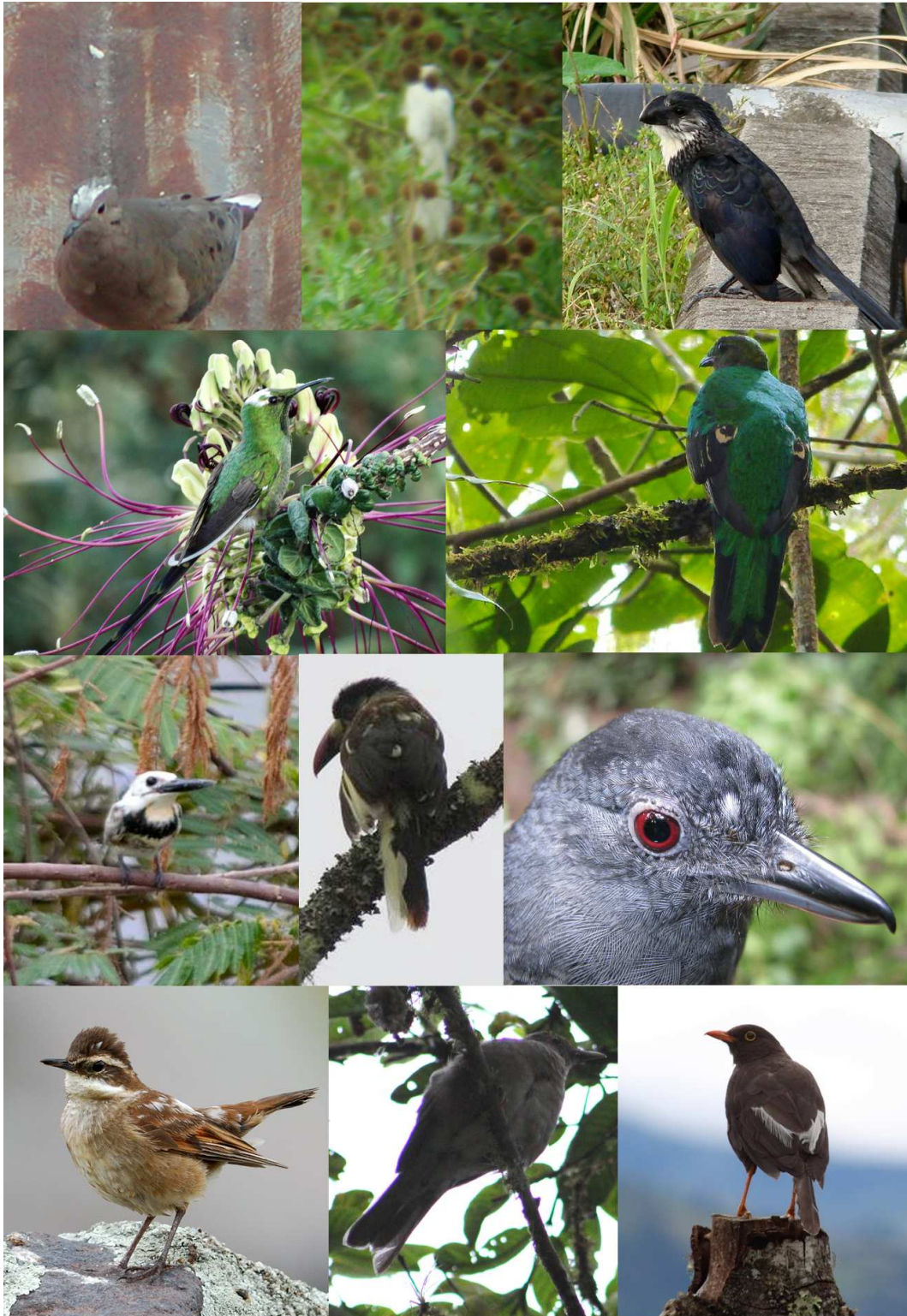
Figura 2: Casos de leucismo en Tórtola Orejada Zenaida auriculata de Quito, prov. de Pichincha (1ª fila, izquierda); Garrapatero Piquies-triado Crotophaga sulcirostris de la Laguna del Canción, prov. de Guayas (1ª fila, centro); Garrapatero Piquiliso Crotophaga ani de Cañon de los Monos, prov. de Orellana (1ª fila, derecha); Colacintillo Colinegro Lesbia victoriae de Quito, prov. de Pichincha (2ª fila, izquierda), Quetzal Cabecidorado Pharomachrus auriceps de Maquipucuna, prov. de Pichincha (2ª fila, derecha); Martín Pescador Americano Verde Chloroceryle americana de Isla Santay, prov. de Guayas (3ª fila, izquierda); Tucán Andino Pechigrís Andigena hypoglauca de la vía Carmelo - Julio Andrade, prov. de Carchi (3ª fila, centro); Batará Alillano Thamnophilus schistaceus de la Estación Científica Yasuní, prov. de Orellana (3ª fila, derecha); Cinclodes Alifranjeado Cinclodes fuscus del Parque Nacional Cotopaxi, prov. de Cotopaxi (4ª fila, izquierda); Mirlo Ecuatoriano Turdus maculirostris de Nanegalito, prov. de Pichincha (4ª fila, centro); y Mirlo Grande Turdus fuscater de la Reserva Ecológica El Ángel, prov. de Carchi (4ª fila, derecha).