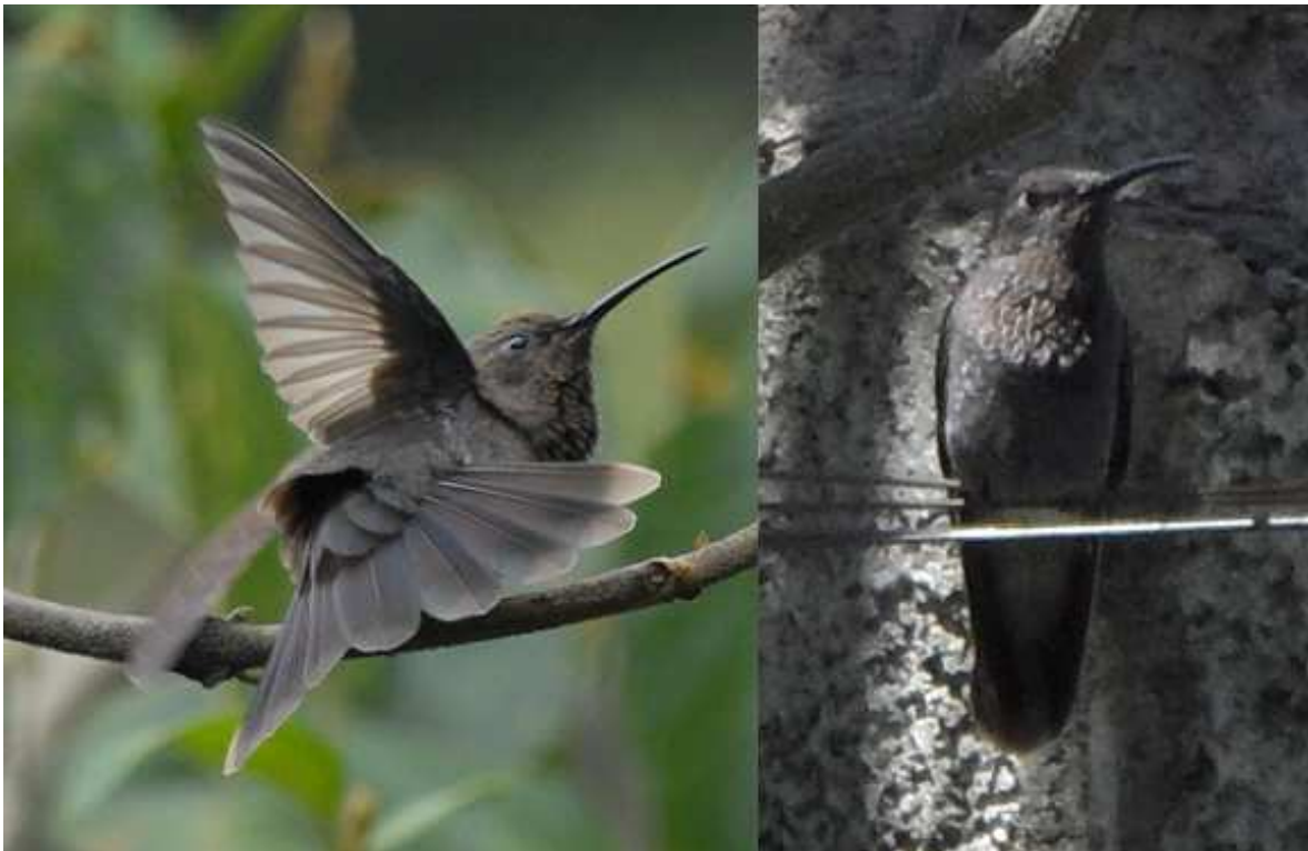
Figura 5: Individuos melánicos de Orejivioleta Brillante Colibri coruscans observados en el Jardín Botánico de Quito (izquierda) y Amagñaña (derecha), prov. de Pichincha, Ecuador.